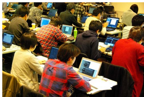
昨年開催した「仙台CTF2017」の会場

昨年11月に第1回目となる「仙台CTF 2017」を開催し、ご好評をいただきました。ご要望にお応えし、今年は、技術勉強会と技術競技会を分けて開催します。ぜひ、奮ってご参加ください。